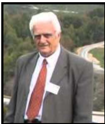
Profesor univ. dr. Emeritus VASILE CUCU 7 aprilie 1927 – 12 iunie 2015

La 7 aprilie 1927 se năștea, în satul Igiroasa, județul Mehedinți, cel care peste ani avea să ajungă una dintre marile personalități ale geografiei din România. A crescut într-o atmosferă sănătoasă a satului românesc, pe care avea să-l evoce, mai târziu, cu mult respect și realism în unele din lucrările sale ( Geografia satului românesc ).