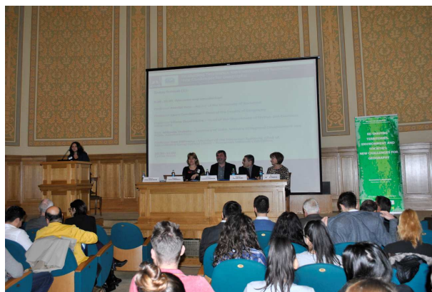
Photos: The International Conference "Re-shaping Territories, Environment and Societies: New Challenges for Geography" – the opening ceremony